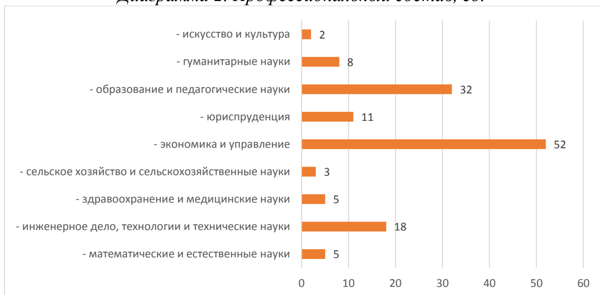
Диаграмма 2. Профессиональный состав, ед.

В 2019 году в Министерстве труда и социального развития Республики Саха (Якутия) за прошлый год принято 18 человек. Из резерва кадров 2, на конкурсной основе 15. Всего в резерве состоит 19 человек на 10 должностей государственной гражданской службы, 9 из которых включены в резерв в 2019 году.